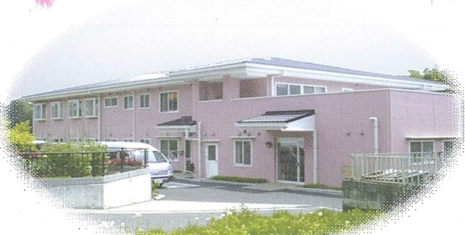
光の園町田の全景

当ホームは、利用者様の終の棲家となる様ターミナルケアを視野に入れ運営に取り組んでいます。(ターミナル期の身体的状況を主治医と相談しながら可能な限り利用者やご家族の希望に沿う様なケア体制を取っています。)