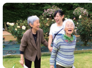
季節のイベントも充実