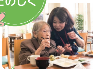
安心の認知症ケア