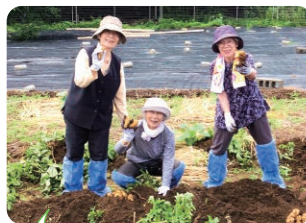
ときには畑仕事も